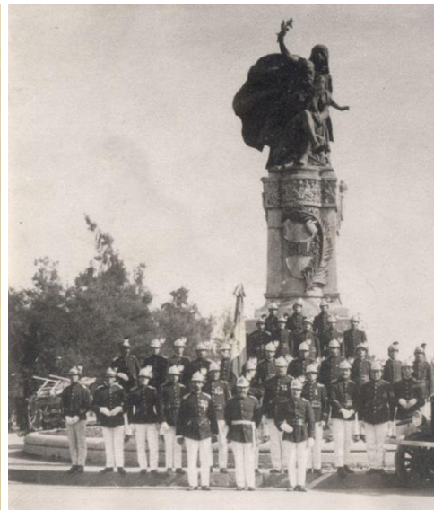
Grupo general de voluntarios de la T.A. Compañía